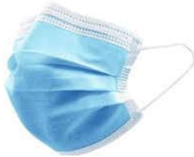
Fig. 2 Mascherina chirurgica

Per quanto concerne la menzionata mascherina chirurgica la normativa a cui riferirsi è rappresentata dal D.Lgs. 37/2010 (Dispositivi Medici-DM, che ha modificato il precedente D.Lgs. 46/97), dal Regolamento (UE) 2017/745 relativo ai dispositivi medici, nonché dal Regolamento (UE) 2020/561 per quanto riguarda le date di applicazione di alcune delle sue disposizioni (ad es. la valutazione della conformità è posticipata al 26.05.2021).