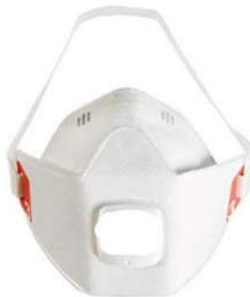
Fig. 3 Facciale filtrante

Per i facciali filtranti FFP1, FFP2 e FFP3 , definiti DPI, la legislazione di riferimento è costituita dal D.Lgs. 81/2008 e s.m.i. ed, in particolare, dal Titolo III, Capo II, nel quale sono state inserite le modifiche apportate con il D.Lgs. 17/2019 (atto di inserimento nell'ordinamento nazionale del Regolamento UE n. 2016/425 del Parlamento europeo e del Consiglio, del 9 marzo 2016, in materia di DPI).